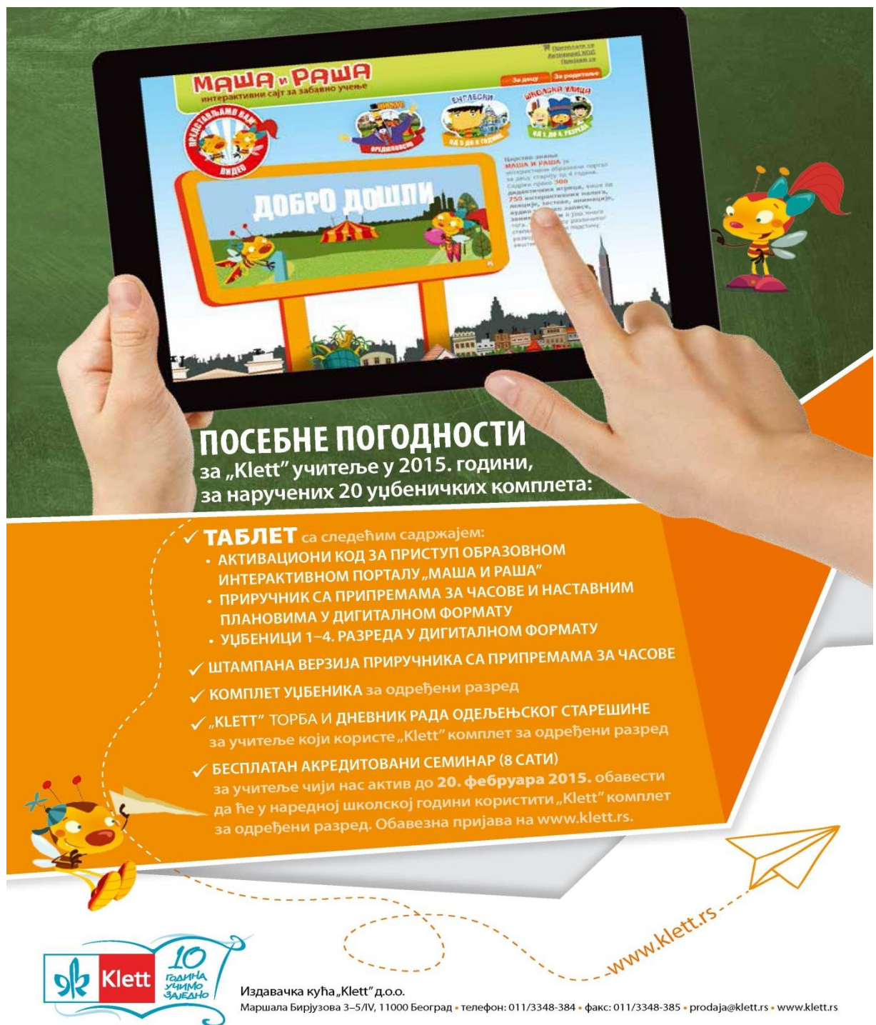
Слика 1: погодности за наставнике који изаберу уџбенике